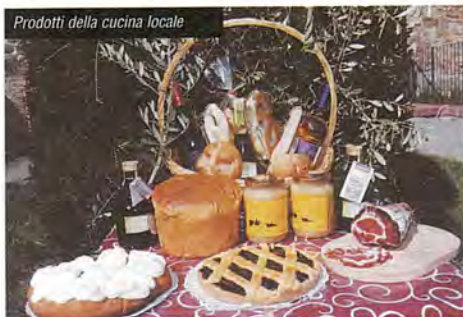
Prodotti della cucina locale

Il clima mite grazie al vicino lago Trasimeno e la dolcezza del paesaggio che ha ispirato il Perugino conferiscono ai prodotti della terra - olio, vino, frutta, ortaggi - sapori speciali, fedelmente riportati sulle tavole dei ristoranti locali. A ciò si aggiungono l'ospitalità della gente, la qualificata ricettività, la piacevolezza delle passeggiate nel verde. Il comune è compreso in una bella area naturalistica, quella del Monte Pausillo, facilmente raggiungibile a piedi, in bici o a cavallo.